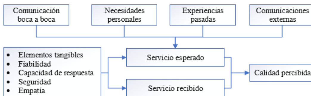
Figura 2. Formación de la calidad percibida

Uno de los objetivos fundamentales de la calidad es lograr la satisfacción del cliente. Como consecuencia de los cambios en los gustos y necesidades de los turistas, la incorporación de nuevas tecnologías, la intensificación de la competencia y la preocupación por el deterioro del medio ambiente, entre otros factores, la oferta de un producto rígido y masivo ya no satisface plenamente la demanda. Los clientes actualmente precisan un interés creciente por la prestación de un servicio individualizado y de calidad [15]. A continuación, dentro de la figura 2 se esquematiza las etapas para la formación de la calidad percibida.