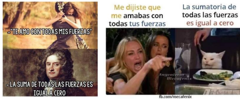
Figura 1: Diapositiva de los memes como elemento comunicativo de las leyes de Newton