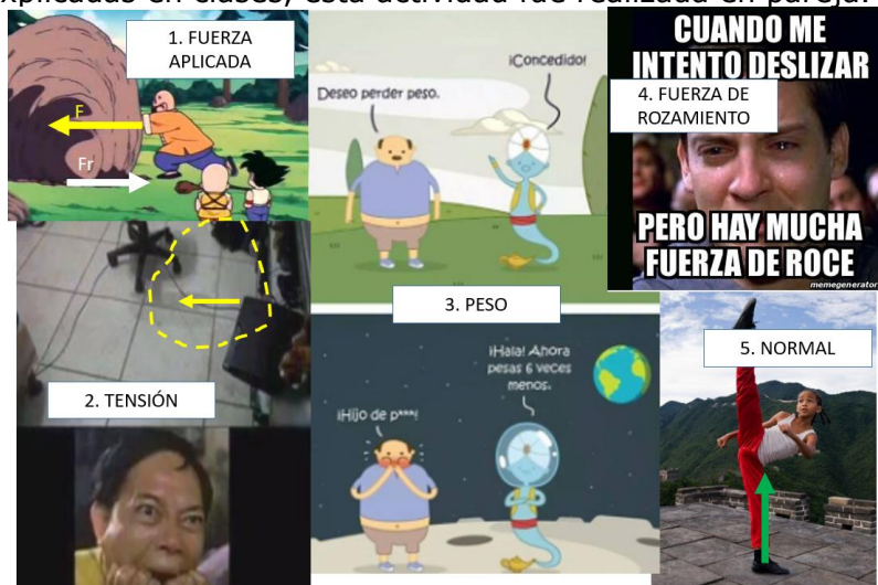
Figura 2: Collage de memes de los cinco tipos de fuerzas explicados en clase